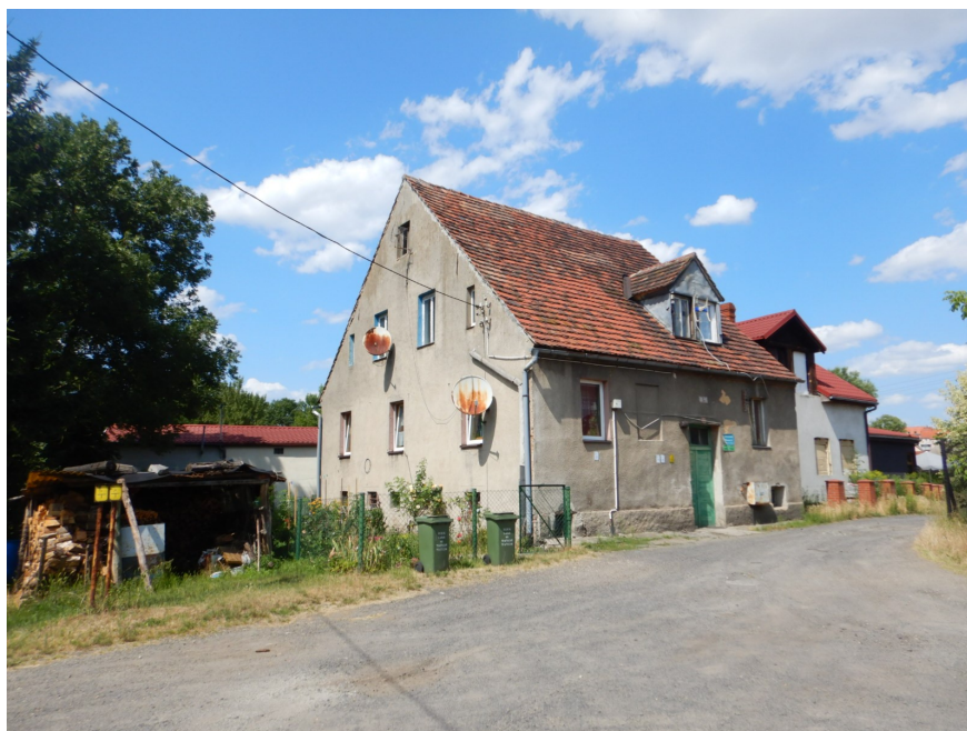
Ogólny widok budynku

na sprzedaż lokalu mieszkalnego Nr 4 znajdującego się w budynku położonym w Lubaniu przy ul. Włókienniczej 5A wraz z udziałem we współwłasności nieruchomości gruntowej (działka nr 57/13, AM 18, Obręb II o powierzchni 478 m 2 , JG1L/00028431/2)